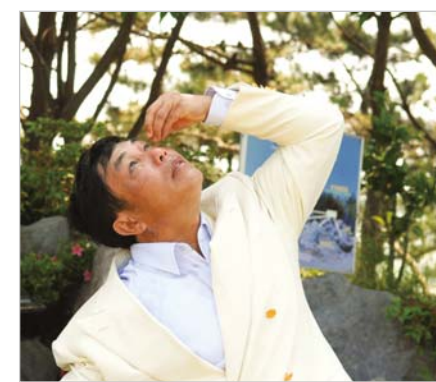
Он исцелился от астигматизма левого глаза, омыв глаза сладкой водой Муана.

Сегодня они живут счастливой христианской жизнью, имеют материальные благословения и крепкое здоровье. Испытав такие дела Божьи, я торожусь для Господа с радостью и благодарностью.