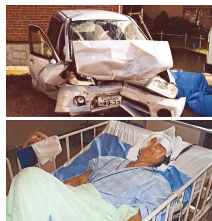
Она чудом осталась в живых после лобового столкновения с выехавшим на встречную полосу автомобилем, но последствия аварии долгое время вызвали мучения.

К моему удивлению, со второго дня моего пребывания в Корею Бог начал исцелять последствия ДТП. Получив платочную молитву от пастора Су Ёл Чо во время молитвенного собрания на рассвете, 1 июня, я заметила, что