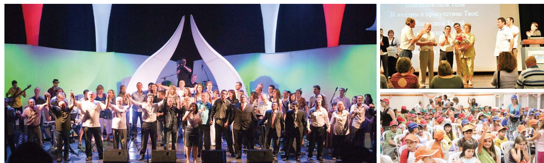
«Хрустальный форум» проводит «Музыкальный фестиваль-2010» в МЦК города Хайфы 21 мая; пасторы молятся о верующих и благовести в стране вместе с 1.500-ми участниками

«Хрустальный форум» способствует духовному пробуждению Израиля, организуя семинары на тему о супружеской жизни и летние лагеря для детей