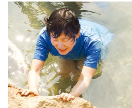
Молитва о желании сердца и погружение в источник сладкой воды Муана.

паралич вокруг моего лба исчез. На следующий день состоялась моя долгожданная встреча со старшим пастором, и меня переполнили чувства, которые невозможно выразить словами.