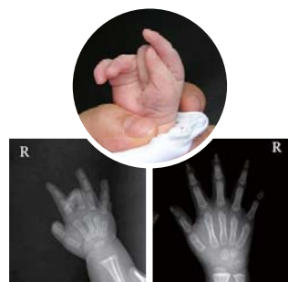
До молитвы 5 месяцев (30 июля 2008 г.) После молитвы 37 месяцев (15 марта 2011 г.)

26 ноября 2010 года мы покаялись в этих грехах и приняли молитву д-ра Джей Рока Ли. Несколькими днями позже пальцы нашего сына стали постепенно выпрямляться. Видя, как пальцы его приходят в норму, мы обрели веру и 1 января, во время молитвенного собрания Даниила, решили дать 21-дневный молитвенный обет. После нашей молитвы сын был полностью исцелен. Он может крепко держать в руках предметы и стал более активным. Аллилуйя!