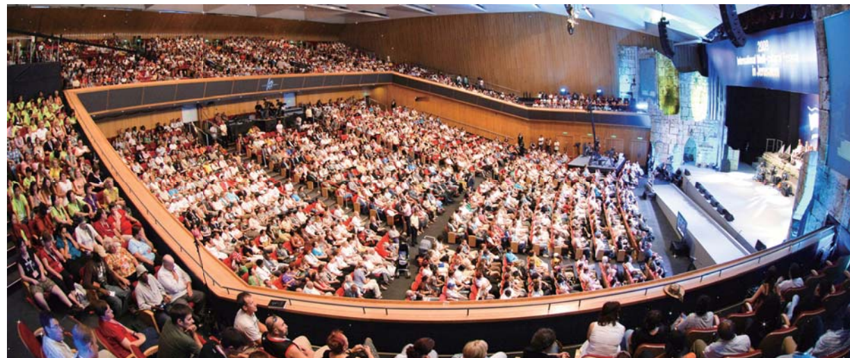
Прозвучавшая на прошедшем в Международном центре конгрессов в Иерусалиме (МЦК) «Объединенном крусеиде в Израиле - 2009» проповедь о том, что Иисус Христос есть Мессия, транслировалась в прямом эфире на 220 стран.