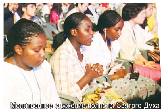
Молитвенное служение полноты Святого Духа