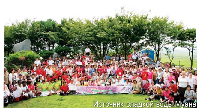
Источник сладкой воды Муана