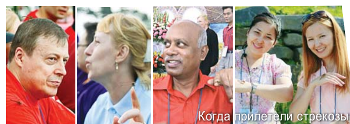
Когда прилетели стрекозы

Летний лагерь «Манмин» - это духовный праздник, имеющий мировое значение. Основание называть его так дает тот факт, что в нем приняли участие 330 пасторов и верующих из 29-ти стран, в частности из США, Канады, Бельгии, Казахстана, Израиля, Сингапура, Японии, с Филиппин и из Китая. Мы записали отзывы тех, кто участвовал в семинаре с жадой услышать проповеди, помолиться и увидеть знамения и чудеса.