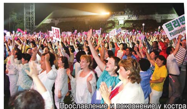
Прославление и поклонение у костра