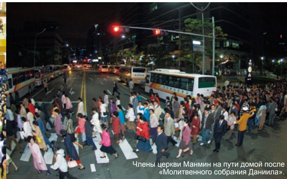
Члены церкви Манмин на пути домой после «Молитвенного собрания Даниила».

Осень приносит свои плоды, благоухает и молитва Манмин.