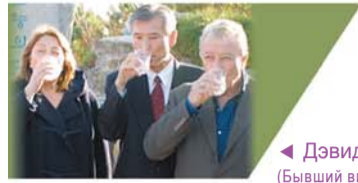
◀ Дэвид Вайсман (Бывший вице-президент Перу – справа)

«Я был в коме и умирал, но вернулся к жизни!». Брат Джозеф Китс (справа, на заднем плане)