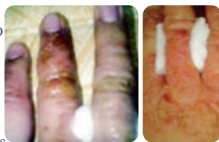
Antes de oración