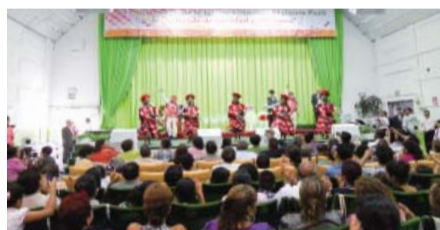
Servicio del sexto aniversario de la Iglesia Manmin de Perú.