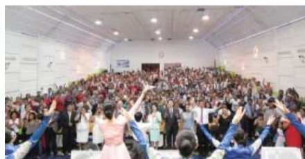
Tiempo de alabanzas durante el Seminario para Pastores realizado en la Iglesia Manmin de Perú.