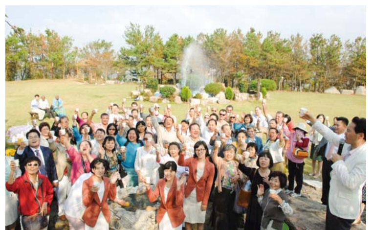
Visita la Sitio del Agua Dulce de Muan donde se despliega el poder de Dios (Muan, Provincia de Jeonnam, Corea).