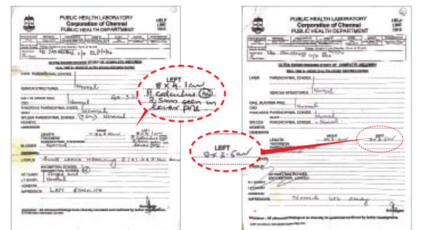
Antes de la oración: Cálculo de 3,5 cm. en el riñón izquierdo.