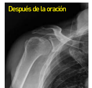
Las partes fracturadas de la tuberosidad mayor del húmero fueron reintegradas a sus lugares como si hubieran sido unidas a través de la cirugía; y el hueso dislocado también estaba en su lugar.