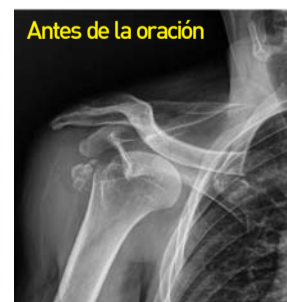
Debido a una lesión externa, la articulación del hombro derecho se dislocó y una mayor tuberosidad del húmero se rompió en trozos pequeños.

El 3 de julio recibí la oración del Pastor Principal cuando volví a la iglesia luego de haber estado en la casa de oración de la montaña. Sentí frescura y agrado durante la oración. Por la noche, me quité el soporte de protección y comencé a vivir normalmente. ¡Aleluya!