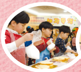
Mi propia receta: Tarta de amor