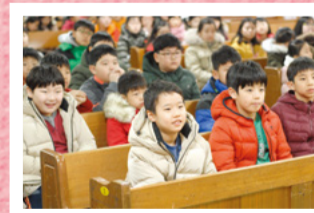
Mis sueños y mi visión: ¿Qué hacen los obreros levitas (los trabajadores de la iglesia a tiempo completo)?