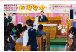
Para que permanezcan alertas espiritualmente en los últimos días. Para que oren en plenitud.