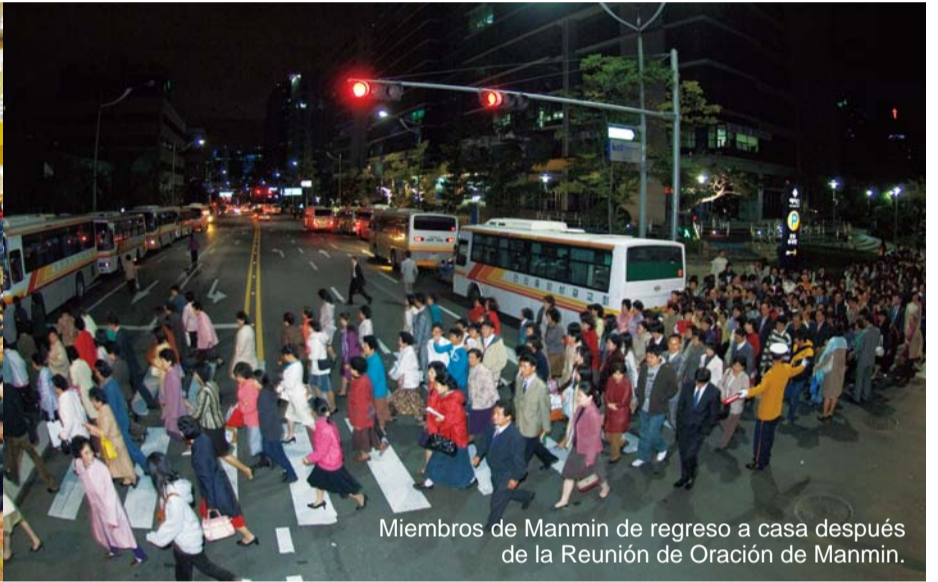
Miembros de Manmin de regreso a casa después de la Reunión de Oración de Manmin.

A medida a que el otoño va llegando a su fin, la fragancia de la oración en Manmin se va intensificando.