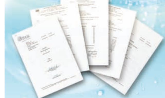
Resultados de las Pruebas realizadas por la FDA

El agua, al igual que el aire, es uno de los elementos más importantes en la conservación de la vida. Podemos vivir sin ingerir alimentos durante 4 a 6 semanas, pero no podemos sobrevivir más de una semana sin tomar agua. El setenta por ciento del cuerpo humano está constituido por agua, lo cual ha conducido a las personas a buscar mejores fuentes de agua para su salud. Cada estudioso posiblemente tenga su propio concepto con respecto al agua, pero la mayoría de ellos concuerdan en que el agua de buena calidad debe tener abundantes minerales, bajo nivel de alcalinidad y la cualidad de ser refrescantemente vigorizante.