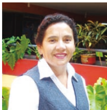
Yo trabajo como enfermera en el hospital nacional. Desde que mi padre falleció

hace 14 años, yo no podía dormir por la depresión. Desde entonces, yo padecía espondilartrosis. Era demasiado doloroso estar sentada durante algún tiempo o recostarme en la cama. El hospital no tenía ningún tratamiento especial aparte de analgésicos y vitaminas. Incluso he pensado que con un dolor agudo "¿qué de bueno tiene para mí el vivir?"