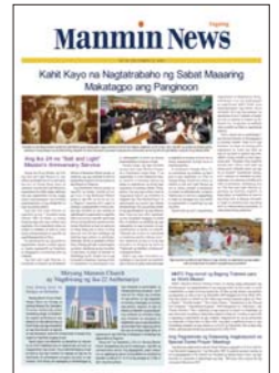
Filipino (Tagalo) (publicado quincenalmente)