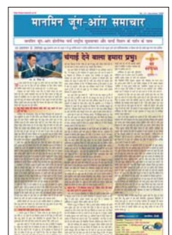
Hindi (publicado mensualmente)