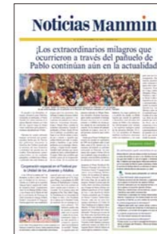
Español (publicado quincenalmente)