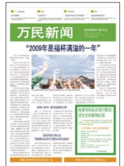
Chino Simplificado (publicado semanalmente)