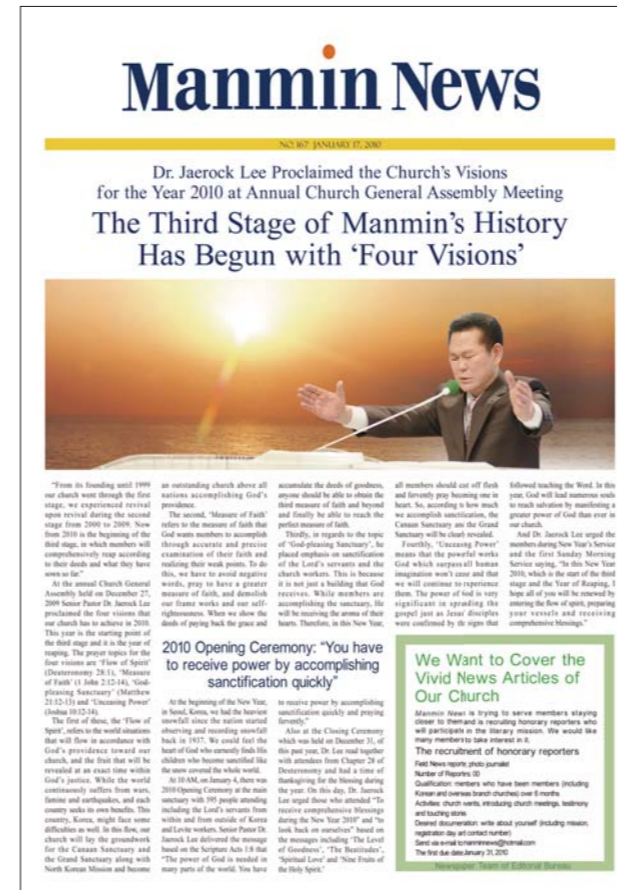
La versión al inglés de Noticias Manmin es traducida semanalmente y encabeza la misión mundial.

de Publicaciones, y luego de ser revisados por los obreros en el Departamento de Interpretación son distribuidos a muchos países por medio de correo electrónico. El Equipo de Misiones Internacionales de la Oficina de Administración se encarga en particular de la edición de Noticias Manmin al indonesio, tamil e hindi, los cuales son publicados en los respectivos países. Las traducciones de Noticias Manmin están siendo entregadas a las iglesias, pastores y miembros que están deseosos del evangelio de santidad y el poder de Dios en muchos países tales como EE. UU., China, Malasia, Singapur, Taipéi, las Filipinas, Kenia, R. D. de Congo, Japón, China, Perú, Brasil, Angola, Rusia, Ucrania, Kazakstán, Belarús, Israel, Indonesia, India entre otros. También se lo está enviando a las iglesias filiales y asociadas a nivel internacional donde se está usando para el crecimiento espiritual y el evangelismo, a fin de guiar a muchas personas a la Salvación. Noticias Manmin es muy útil, especialmente en países donde no disponen de los recursos de una misión establecida. Realmente, Noticias Manmin está sembrando fe en los corazones de muchas personas y permitiéndoles conocer el camino para recibir respuestas y bendiciones.