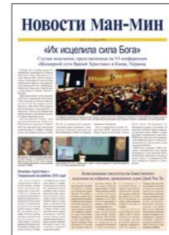
Ruso (publicado quincenalmente)