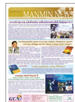
Tamil (publicado mensualmente)