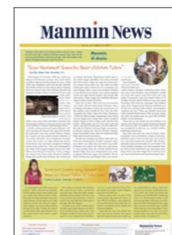
Indonesio (publicado mensualmente)