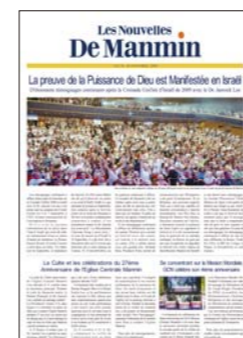
Francés (publicado mensualmente)