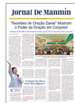
Portugués (publicado mensualmente)