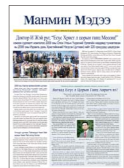
Mongol (publicado mensualmente)