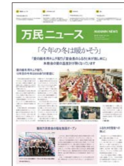
Japonés (publicado quincenalmente)