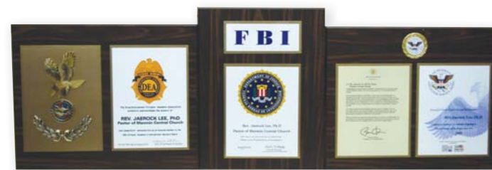
Placa de nombramiento Premio del Presidente al Servicio Voluntario Placa de reconocimiento

El Dr. Jaerock Lee recibió el Premio del Presidente de los Estados Unidos al Servicio Voluntario de parte del Presidente Barack Obama. Esta condecoración se otorga a aquellos quienes contribuyen al desarrollo de la sociedad mediante actividades voluntarias en los Estados Unidos. El Dr. Lee ha orado por la sanidad de todo tipo de enfermedades y dolencias en decenas de cruzadas conducidas en los Estados Unidos, Israel, India, Pakistán, y muchos países más. Innumerables