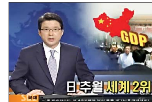
China superó a Japón como la segunda mayor economía del mundo, largest economy