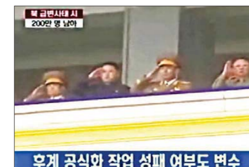
El hijo del líder norcoreano se levanta como posible sucesor.