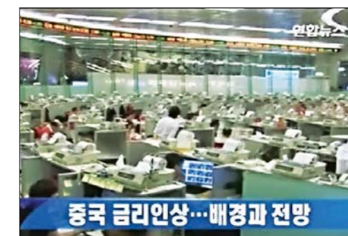
¿Qué significa el incremento del tipo de cambio por parte de China?