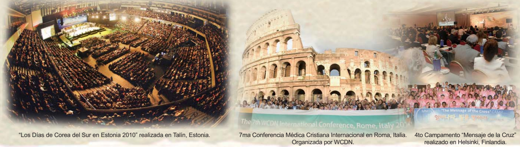
"Los Días de Corea del Sur en Estonia 2010" realizada en Talin, Estonia.

En esta cruzada en Estonia se manifestaron las explosivas obras del Espíritu Santo y numerosas personas experimentaron y glorificaron a Dios luego de recibir bendiciones y sanidad. Esta cruzada animó a la comunidad europea cristiana en retroceso y puso a los creyentes en Cristo en llamas por el Espíritu Santo.