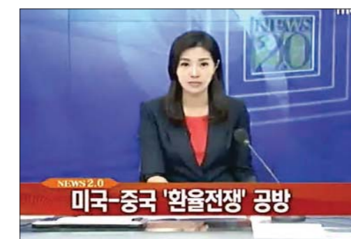
Guerra por el tipo de cambio entre EE. UU. y China