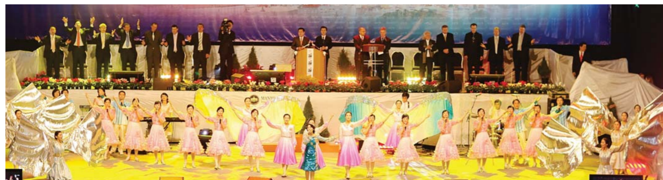
El equipo de presentaciones de la Iglesia Central Manmin cantó alabanzas en estonio, inglés y ruso. Sus excelentes presentaciones cristianas culturales elevaron el gozo y emoción de los presentes.