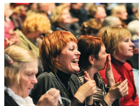
La audiencia estuvo complacida.