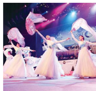
Las hermosas danzas que reflejan el Cielo sorprendieron grandemente a los presentes.