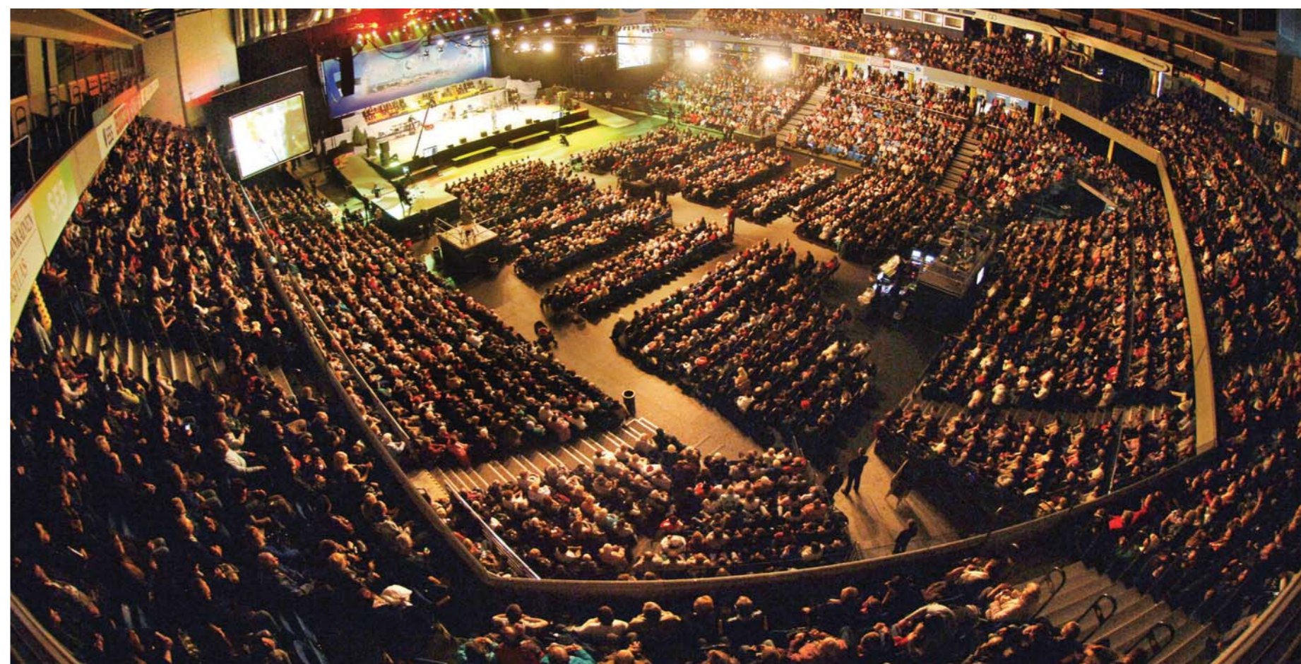
La Cruzada de Sanidad Milagrosa Estonia 2010 realizada en el Coliseo Saku Suurhall en Tallin, capital de Estonia, los días 30 y 31 de octubre, se registró como uno de los eventos cristianos de mayor concurrencia en la historia de este país. Se transmitió en vivo a 220 países vía satélite, cable, aire e Internet. Se caracterizó por las decisiones de muchos no creyentes y numerosas obras de sanidad. Se espera que muchas obras sorprendentes se realicen en Europa de ahora en adelante.