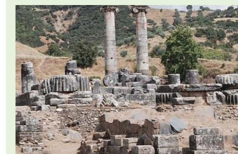
La iglesia en Esmirna