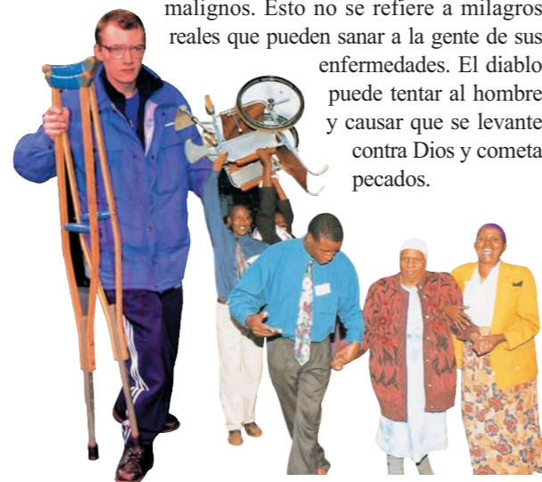
enfermedades. El diablo puede tentar al hombre y causar que se levante contra Dios y cometa pecados.

Si alguien tiene la capacidad para hacer milagros y manifestar las obras poderosas de Dios, entonces esta persona evidentemente demuestra ser un hombre de Dios. Aquellos milagros realizados en el nombre de Jesucristo por el poder de Dios producen frutos de bondad y permiten que la gente obtenga la salvación y glorifique a Dios. No obstante, aquellos que hacen lo que aparenta ser milagros por medio de trucos y hechicería, engañan a la gente y los llevan a la muerte eterna por causa de sus deseos egoístas para beneficio y vanagloria propia. Algunos creyentes dicen que el diablo enemigo ‘hace’ milagros, señales y prodigios, alegando que algunos versos de la Biblia lo registran. Por ejemplo: mencionan lo escrito en Mateo 24:24 que dice: “Porque se levantarán falsos Cristos, y falsos profetas, y harán grandes señales y prodigios, de tal manera que engañarán, si fuere posible, aun a los escogidos”. En este verso se mencionan las ‘grandes señales y prodigios’, lo cual se refiere a las obras realizadas por hechicerías y trucos mediante las obras de los espíritus malignos. Esto no se refiere a milagros reales que pueden sanar a la gente de sus enfermedades. El diablo puede tentar al hombre y causar que se levante contra Dios y cometa pecados.