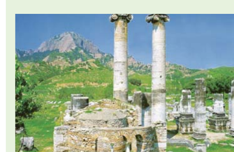
La iglesia en Sardis