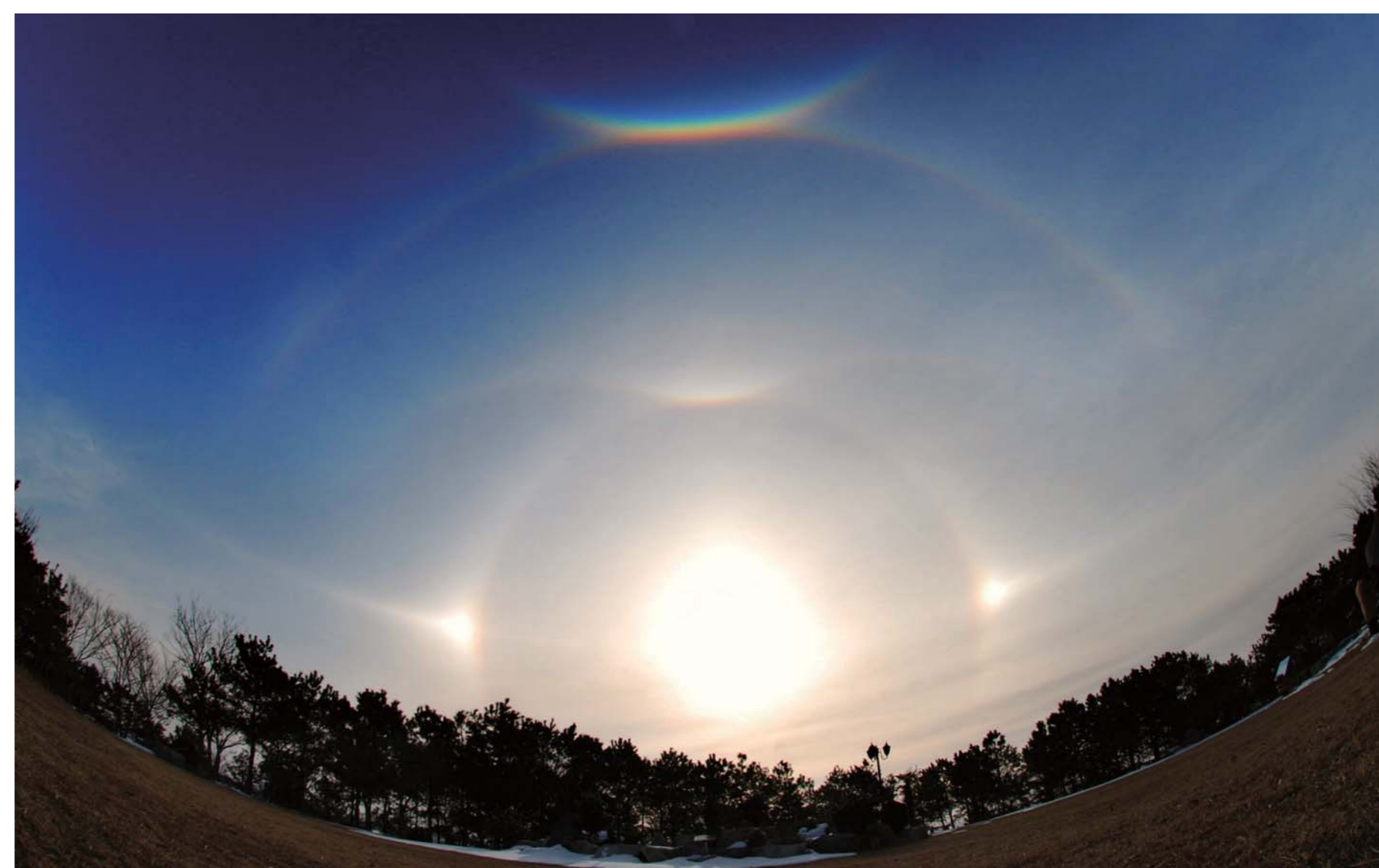
El 27 de enero de 2011, múltiples arcoíris complejos de diversas formas aparecieron en el cielo desde las 9:30 hrs. hasta las 10:30 hrs. sobre el Sitio del Agua Dulce de Muan, ubicado en #153 San, Cheonjang-ri, Haeje-myeon, Muan-gun, Jeollanam-do.

Raros casos de arcoíris hermosos nos recuerdan el amor de Dios y Sus promesas