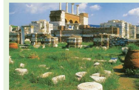
La iglesia en Efeso

Amados hermanos y hermanas en Cristo: En la actualidad hay muchas iglesias que son muy parecidas a estas siete iglesias, por lo tanto es verdaderamente un requisito que los creyentes en Cristo examinen su fe con el mensaje a las "Siete Iglesias" y que escojan seguir las enseñanzas del Señor en sabiduría de lo Alto. ¡Ruego en el nombre del Señor Jesucristo, que todos ustedes puedan ser imitadores de la iglesia en Filadelfia y sean elogiados por guardar la Palabra de Dios con poca fuerza!