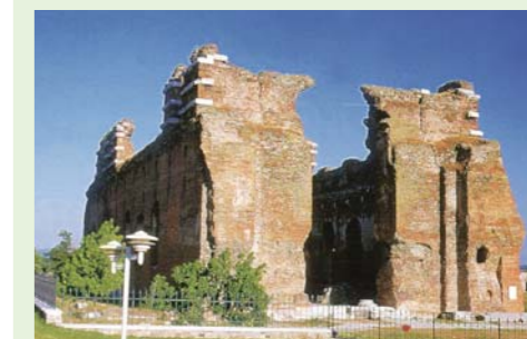
La iglesia en Pérgamo