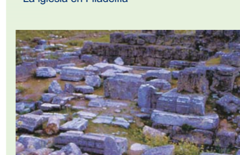
La iglesia en Laodicea