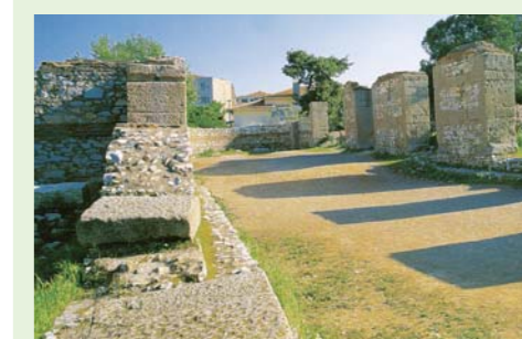
La iglesia en Tiatira