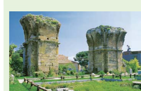
La iglesia en Filadelfia